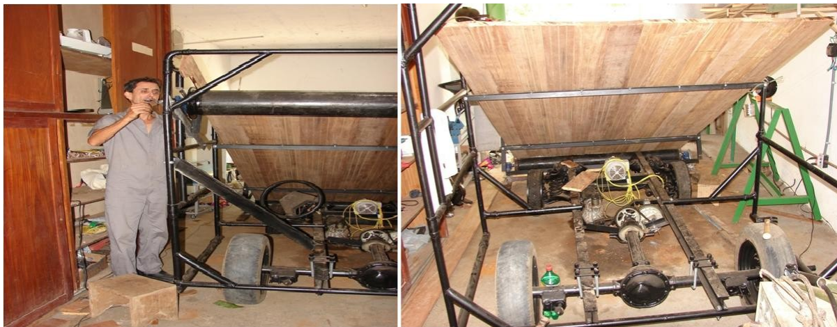
FIGURA 1. (esq.) Eng.º Agrícola do INCAPER construindo máquina compostadeira na oficina da UEPA, Linhares, ES; e (dir.) Detalhes interno da compostadeira em processo de construção.

A máquina foi construída em uma oficina adaptada na própria UEPA (Fig. 1). Para a sua construção foram utilizadas peças novas e usadas (de carros e motos).