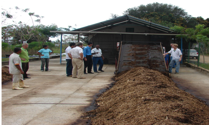
FIGURA 2. Teste participativo (com agricultores familiares, técnicos, estudantes e outros) da máquina compostadeira na UEPA, Linhares, ES.

Até o momento, os diversos testes contaram com a participação de diversos atores sociais (Fig. 2). Essas avaliações participativas são de fundamental importância, pois, através de críticas e sugestões, a máquina está se tornando cada vez mais adaptada a realidade da Unidade.