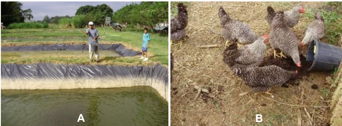
FIGURA 3. Atendimento de algumas demandas por composto orgânico na UEPA: (A) Composto sendo lançado nos tanques de criação de peixes para fertilização; e (B) Fornecimento para complementação mineral das aves.

Sendo assim, os problemas anteriormente identificados de gastos excessivos de mão de obra para o reviramento manual das leiras de composto orgânico, foram minimizados com a construção e a utilização da máquina compostadeira para a realização desta função. Ao mesmo tempo, devido ao maior volume de resíduos orgânicos trabalhados, a oferta de composto orgânico na UEPA se tornou maior, podendo atender a todas as demandas específicas da Unidade (Fig. 3).