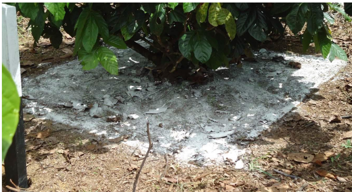
Figura 4 – Aplicação de “Calcário + Gesso” do modo localizado, em experimento conduzido pela Embrapa Amazônia Ocidental na Agropecuária Jayoro Ltda.

para elevar a V = 50\% , Santos et al. (2010) compararam as médias obtidas das aplicações dos tratamentos com as médias do solo original, demonstrando que essa associação promoveu grandes mudanças nos atributos químicos do solo ao longo do perfil, já no primeiro ano após as aplicações dos tratamentos, tais como aumentos de K, de 46,26% na camada de 40 – 60 cm, elevação do Ca de 69,23% para a camada de 60 – 80 cm; aumentos de Mg de 320,00% na camada 20 – 40 cm; incrementos da saturação por bases (V%) de 72,65%; 144,79%; 161,97%; e, 153,63%, respectivamente, nas camadas de 0 – 20 cm; 20 – 40 cm; 40 – 60 cm; e, 60 – 80 cm; reduções da porcentagem de saturação por alumínio (m%) de 25,61%; 19,42%; 24,38%; e de 25,64%, respectivamente, nas camadas de 0 – 20 cm; 20 – 40 cm; 40 – 60 cm; e de 60 – 80 cm, dentre outras constatações importantes.