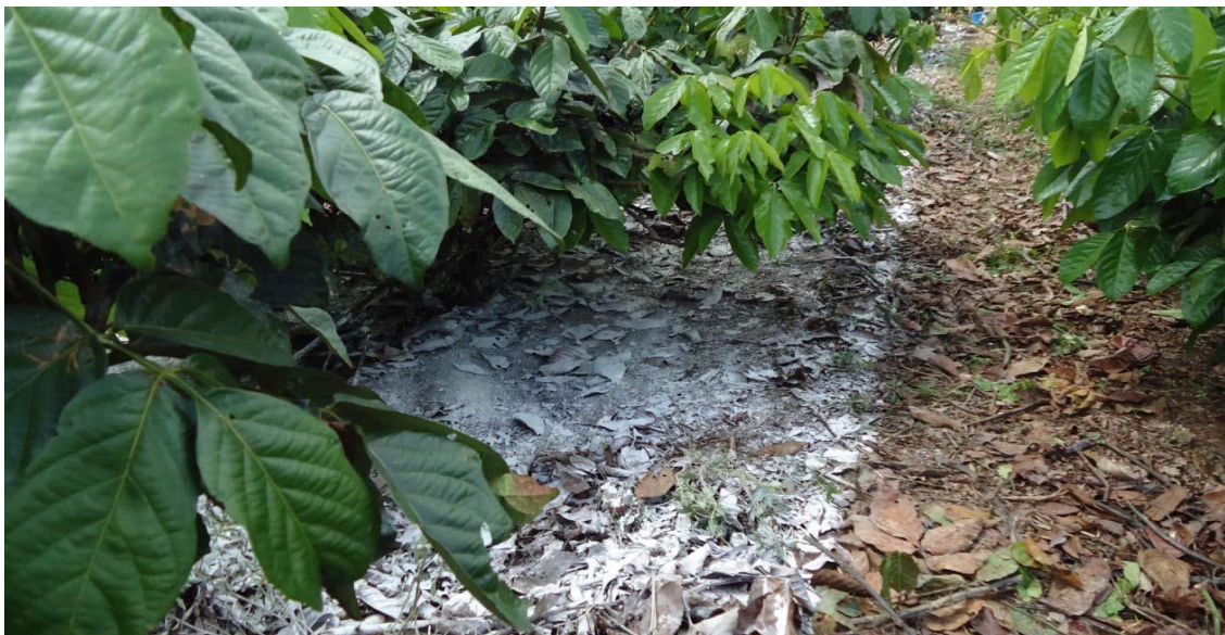
Figura 2 – Aplicação de “Calcário + Gesso” do modo à lanço, em experimento conduzido pela Embrapa Amazônia Ocidental na Agropecuária Jayoro Ltda.

Por sua vez, o calcário, além de ter fornecido os nutrientes Ca e Mg, teria promovido um pH mais favorável para a disponibilização dos macronutrientes e de alguns micronutrientes na solução do solo, levando a aumento da absorção deles.