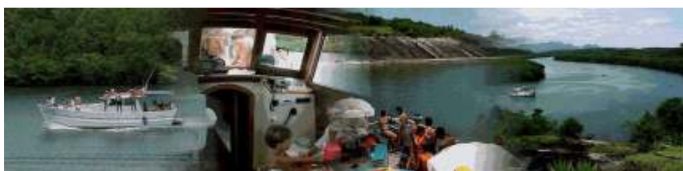
Fig. 2. Passeio pelo rio Piraque-Açu.

Em se tratando da Reserva do Lameirão, podemos dizer que é um bom exemplo da utilização de um recurso natural aliado a práticas economicamente sustentáveis. A prefeitura do município de Vitória vem realizando passeios náuticos no local, chamando a atenção dos visitantes e comunidade da necessidade da preservação desse importante ecossistema.