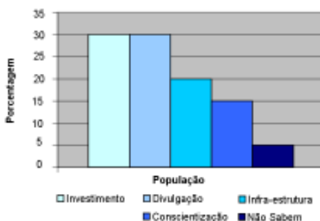
Fig. 1. Necessidades apontadas pela comunidade, para a melhoria da atividade turística.